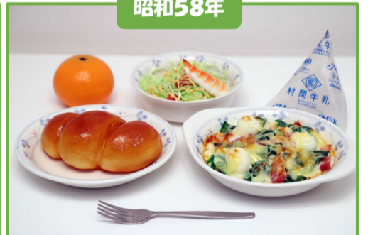
ツイストパン、牛乳、卵とほうれん草のグラタン、えびのサラダ、くだもの(みかん)