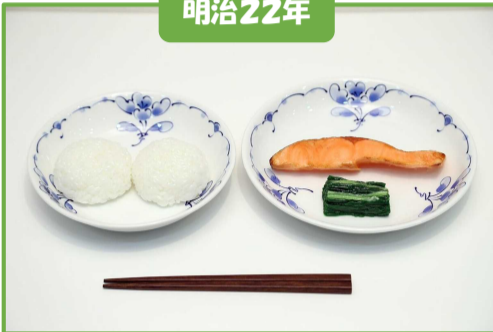
おにぎり、塩鮭、菜の漬物