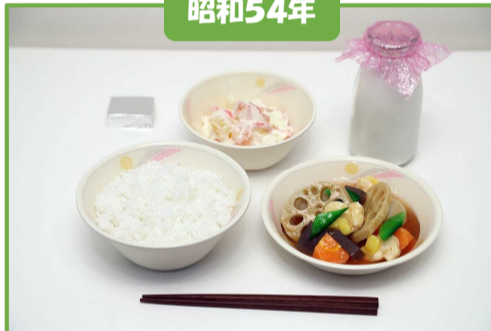
ごはん、牛乳、がめ煮(郷土食)、ヨーグルトサラダ、チーズ