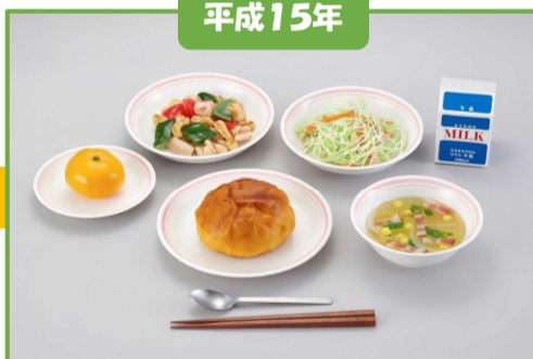
米粉パン、鶏肉とカシューナッツの炒め物、ツナとキャベツの冷菜、コーンスープ、くだもの、牛乳