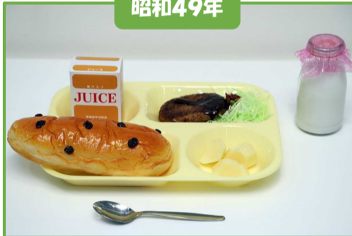
ぶどうパン、牛乳、ハンバーグ、せんキャベツ、粉ふきいも、果汁