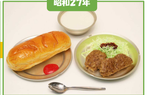
コッパン、ミルク(脱脂粉乳)、鯨肉の竜田揚げ、せんキャベツ、ジャム