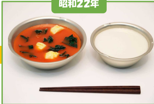
ミルク(脱脂粉乳)、トマトシチュー