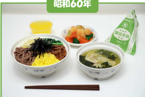
ビビンバ、牛乳、スープ、キムチ風漬け物、ヨーグルトゼリー