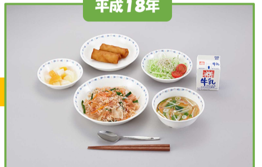
キムチチャーハン、チーズ春巻き、中華風ジャコサラダ、きのこスープ、やわらか杏仁豆腐、牛乳