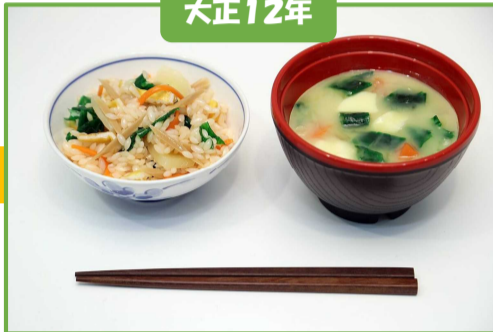
五色ごはん、栄養みそ汁