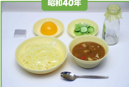
ソフトめんのカレーあんかけ、牛乳、甘酢あえ、くだもの(黄桃)、チーズ